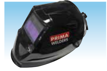
EVOLUTION PLUS cod. 981038