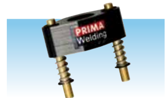
DRT cod. 982012