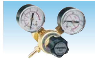
RDP cod. 981012