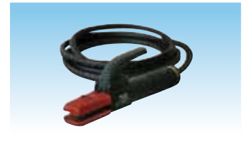
PPE cod. 981123