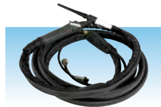
TOT 2540 cod. 982001

E PRIMATIG 200 AC/DC HF , soldadura inverter TIG Y MMA, con posibilidad de encendido en alta frecuencia, facil seleccion de la modalidad TIG AC o DC e MMA. Ofrece un amplio parametro para conseguir soldadura de calidad y alta productividad, ideal para pequeñas y medianas soldaduras en acero, acero inoxidable, aluminio, cobre y titanio. Disponible con mando o pedal a distancia y alimentable de motogenerador.