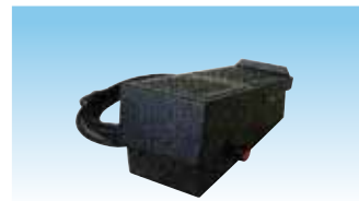
PCAD cod. 982002